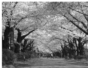
展勝地の桜はおよそ百年まえに小金井の桜が移植されたといわれています。

展勝地の桜はおよそ百年まえに小金井の桜が移植されたといわれています。名勝小金井桜は山桜であるが、小金井公園も展勝地の桜もソメイヨシノが主流である。やはり横に広がりこれぞとばかり咲き誇るソメイヨシノには敵わないのか。 厳しい冬を耐えて、そのなかで赤い芽をつけそれを膨らませ、そして時期が来ると一斉に咲く桜にはその種類によらず独特の美しさと哀れさがある。咲き終わったあとは桜吹雪となり樹の下に白い絨毯を敷き、いつしか土に帰る。そして小枝に若芽のみどりが萌え始める。夏にかけてみどりが鬱蒼と茂り樹の下に影を作り、涼を与えてくれる。秋になるとこれがまた茶色と赤が混在した色の葉になり季節の移ろいを教えてくれる。小金井の桜に和んだ暖かさを感じ、同じ桜のはずの展勝地で観る桜には寒さに耐えた凛とした美しさと、やっと春を迎えたといい歓喜の風情を感じ取る。北上川の向こうから射す西日は桜に紅をそえ梢は茜色に輝く。