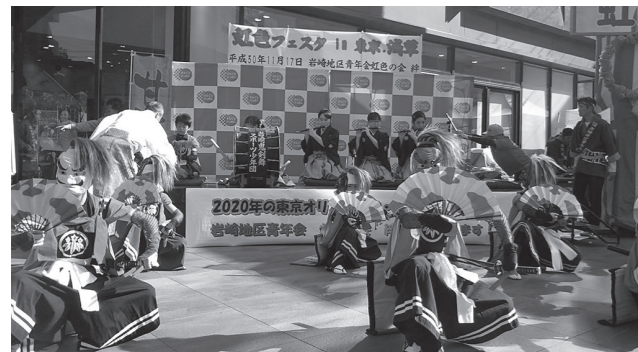
虹色フェスタin東京浅草

昨年11月17日に浅草の商業施設まるごとにつぼんで開催した「虹色フェスタ in 東京浅草」は、岩崎地区青年団「虹色の会」