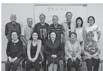
7月定例会の参加者

会の活動としては月一回の定例会(第一木曜日午後3時〜5時まで京橋区民館にて)、「四季語りの会」(京橋地区サークル発表会)、「在京北上ふるさと会」(老人施設での語りボランティアなどを行っております)。更に、いわて銀河プラザでの北上市物産展の販売協力と昔語りも12年続けております。