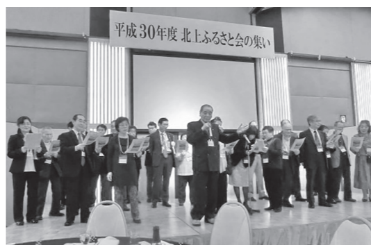
折笠氏作詞「そんな街、北上」を合唱