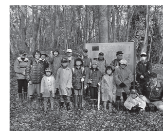
史跡歩く会 大竹廃寺

平成21年更木ふるさと興社の設立に伴い、桑の生産、販売に力を入れており、平成29年には産直「さらきの里ふれあいセンター」がオープンし更木地区民の憩いの場となっています。そして、堀の内のエソヒガンサクラ、永昌寺のシダレカツラや自転車道桜並木やしらゆり公園、更木ビオトープ公園などがあり、自然景観の豊かなところです。（更木・千田恵一事務長）