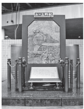
「ああ上野駅」の歌碑

第72回「上野―浅草」コースでは、西郷さんの銅像の後方に新政府軍と戦い僅か一日で散つ