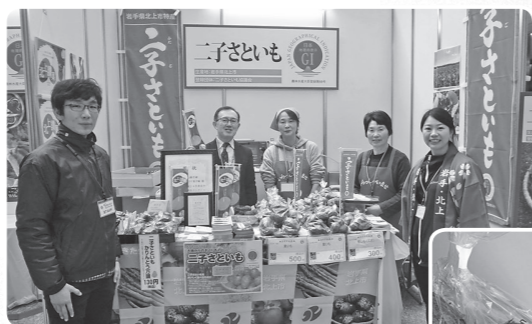
第3回地理的表示フェスティバル

今年2月に東京KITTEで開催した第3回地理的表示フェスティバルには、「二子さといも」とかぎやの「二子さといもかりんとうまんじゅう」と「二子さといもサクサクもちりタルト」を出品し、PRしました。