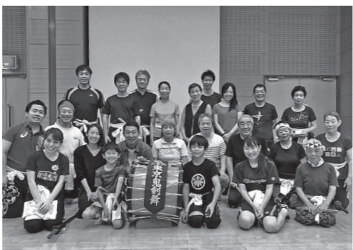
東京鬼剣舞の皆さん