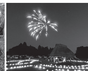
更木夏まつり 前夜祭