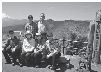
富士山を背景に大野山山頂

都会の雑踏から逃れて山の自然を満喫し、心身を癒す、そんな山歩きの会は、今年4月に丹沢の大野山、5月には