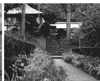
燃え立つ彼岸花に包まれる如意輪寺