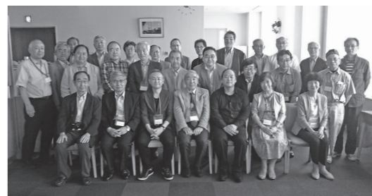
産業人会参加の皆さん

な仕事が出てくる。一方、もともと人間の方が得意とする分野もある。人工知能が人間を理解するのは無理なので人間がAIに寄り添い、パートナーシップを組むことになるだろう。