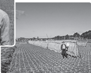
はせがけて天日干