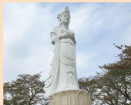
柴田町を一望できる船岡城址公園にある「船岡平和観音」

■人口 約3万8千人 ■面積 約54 km 2 ■姉妹都市提携日 昭和55年1月25日 ■経緯など 藩政時代の城下町です。仙台市から南へ約25kmに位置し、桜の名所・船岡城址公園が有名です。近年は、仙台市の衛星都市として発展し、工業団地も整備されています。当市とは、悲劇の武将・原田甲斐(1671年に起こった伊達騒動の中心人物)の家来が当市口内町に住んでいたという歴史的なつながりがあったことから、昭和55年に姉妹都市となりました。