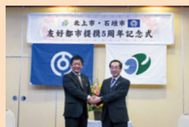
友好都市提携5周年を記念し行われた記念式典

■人口 約4万9千人 ■面積 約229 km 2 ■友好都市提携日 平成26年1月25日 ■経緯など 観光と農業が主な産業です。周囲が美しいサンゴ礁に囲まれた日本最南端の市で、多くの観光客が訪れます。平成5年の岩手県大冷害の際、石垣市の種もみ増殖支援を契機に「かけはし交流」が行われていたことから、平成26年に友好都市となりました。当市とは、石垣島マラソン大会といわて北上マラソン大会へ相互出場などの交流のほか、相互に職員派遣を行っています。