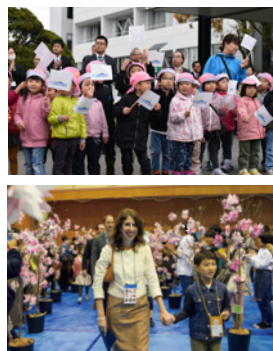
上：歓迎式で出迎える園児たち 下：パーティーで入場するコンコード市長と児童

滞在期間中は、和賀東小学校での給食体験や児童との交流、ホームステイを通じたホストファミリーとの交流、沿岸の復興状況の視察などを