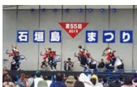
北上・みちのく芸能まつり(上)と石垣島まつり(下)で相互に民俗芸能を披露しました