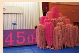
45周年に向け、10万羽の折り鶴で作ったウエルカムツリー

■人口 約12万人 ■面積 約79 km 2 ■姉妹都市提携日 昭和49年10月25日 ■経緯など 商業と工業が主な産業です。東京在住の北上出身者がコンコード市の市長やテレビ局社長と面識があったこと、文化・環境面でも多くの共通点があったことから、昭和49年に姉妹都市となりました。提携以来、コンコード市からALTを派遣してもらうなど交流を図っています。また、当市の伝統芸能「鬼剣舞」の代表が、コンコード市で公演したりと、友好活動・親善活動を積極的に行っています。