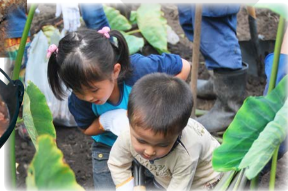
収穫体験イベントの様子