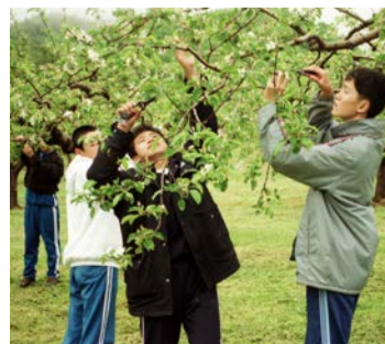
摘花作業を行う中学生たち(平成3年)