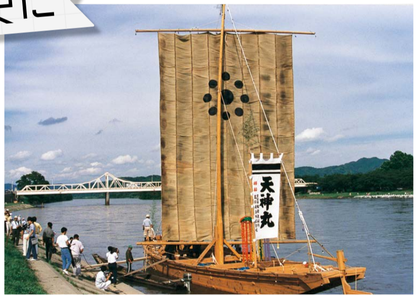
復元されたひらた船(昭和62年)

江戸から明治にかけて、北上川は米をはじめとした物資輸送の大動脈でした。黒沢尻川岸(現在の北上展勝地の対岸)には盛岡藩で最大の河港が設けられ、「ひらた船」と呼ばれる350俵積み的大型船に米などを載せて、石巻まで運びました。