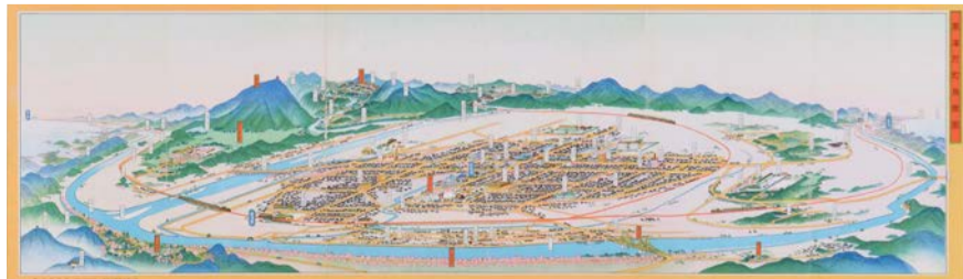
吉田初三郎が描いた黒沢尻町鳥瞰図

■1月11日(出)～3月15日(日)9時30分～17時(月曜休館、祝日の場合は翌日。1月31日(金)は休館) 所=博物館 費=無料 岡博物館 ☎7159-3434 ID1023540