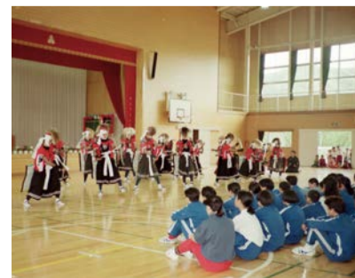
北上市立口内中学校と本市中学校の交流(平成3年)