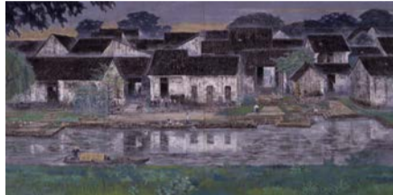
江南水路の朝(1986年) 後藤純男美術館蔵

開催中～1月19日(日)9時～16時30分 所千葉県立美術館(千葉市) 料1,000円、高校・大学生500円、中学生以下・65歳以上無料 問同美術館 ☎043-242-8311 ID1023862