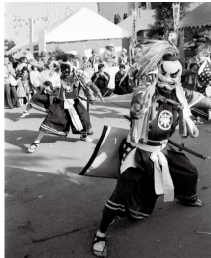
市民まつりで披露された鬼剣舞(昭和61年)

以来、北上市を代表する物産である「きたかみりんご」の販売といった経済的な交流にとどまらず、りんごの摘花作業を通じた両市の中学生の親交など、市民間の交流も盛んに行われていました。今回姉妹都市となることで、今後さらなる交流が期待されます。