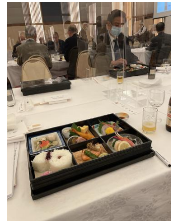
食事は弁当 アルコールは手酌