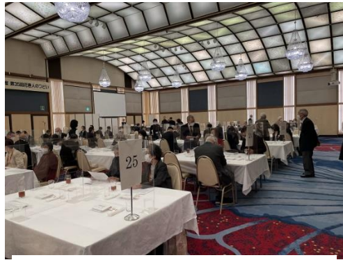
25 テ-ブル×4 人テーブル・アクリル板設置