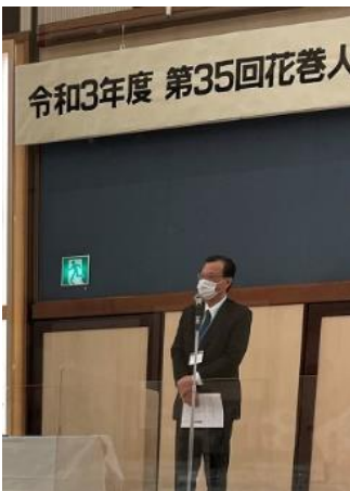
花巻市長あいさつ