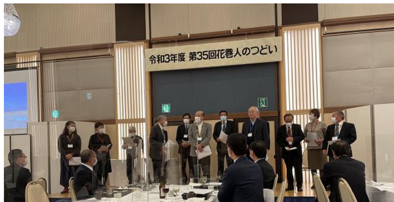
賢治を歌う(精神歌):コロナ感染防止のため会場全員での歌唱は禁止。有志の方のみが壇上で歌う。他の人は心の中で歌う。