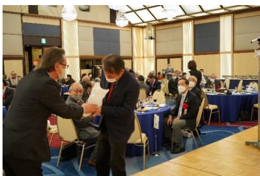
抽選会で北上産お米をいただく

協賛品をご提供いただいた団体 北上市、JAいわて花巻、北上商工会議所、北上観光コンベンション協会 きたかみ地域振興財団、北上・西和賀観光協議会、(株)展勝地、(株)UTO