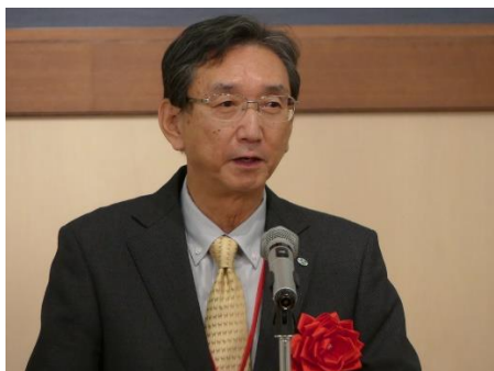
説明する及川北上市副市長