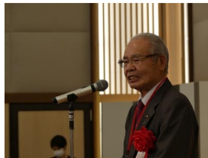
乾杯の音頭をとる八重樫議長