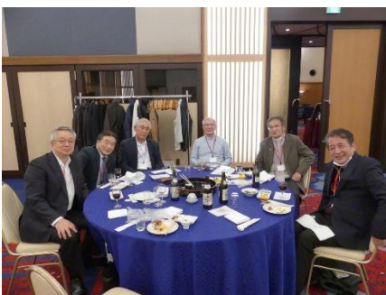
親睦を楽しむ会員の方々

今年は7~8名が出身地ごとの円卓に着席。来賓の方々には各円卓に赴き、3年ぶりの再会、親交を温めた。会場内は参加者皆さんの笑顔であふれていた