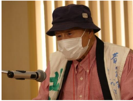
高橋道直「郭公とカッソ花」