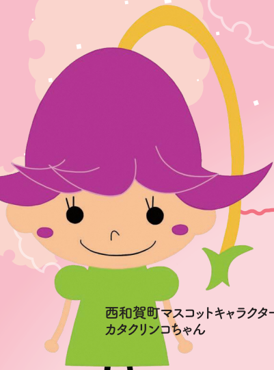
西和賀町マスコットキャラクター カタクリンコちゃん