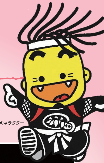
北上市観光キャラクター おに丸くん

とき 2月21日(水)・22日(木) 10:30～19:00(最終日は16:30まで) ばしょ いわて銀河プラザ 東京都中央区5丁目15-1